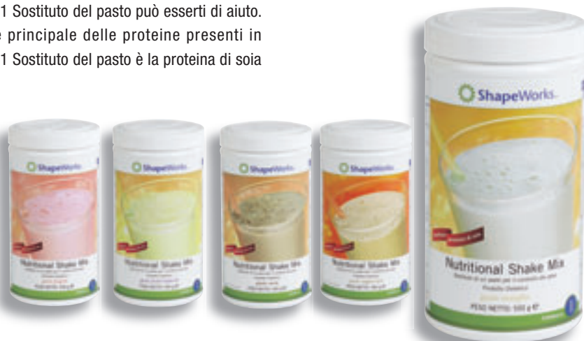
Vaniglia Cod. 0141 Cacao Cod. 0142 Fragola Cod. 0143 Frutti Tropicali Cod. 0144 Cappuccino Cod. 1171

Inoltre, puoi scegliere il tuo frullato tra 5 fantastici gusti: Vaniglia, Fragola, Cacao, Frutti Tropicali, Cappuccino. Vedrai che inizierai con il tuo gusto preferito e poi.....non potrai fare a meno di provare anche gli altri!