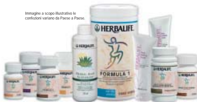
Immagine a scopo illustrativo le confezioni variano da Paese a Paese.

Adesso che sapete come ottimizzare l'assorbimento del cibo, date al vostro apparato digerente una mano in più. I nostri integratori alimentari lavorano insieme all'organismo fornendogli un miglior supporto nutrizionale. Il vostro benessere è la nostra specialità!